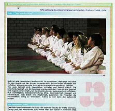
Abbildung 2: Professionelle Clips und Texte motivieren die Jugendlichen, die dargestellten sportlichen Aktivitäten zu testen.